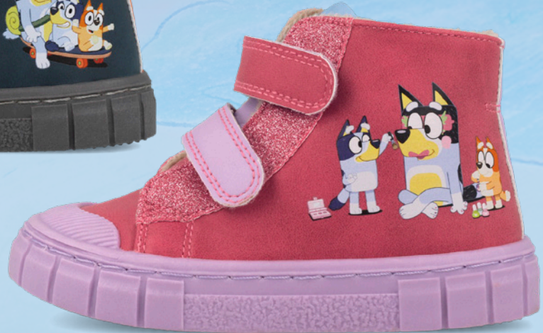
261859 A146 22/30 → 15,90 → 34,95