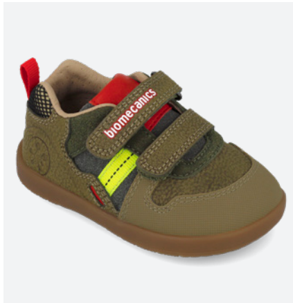
° 261156 B801