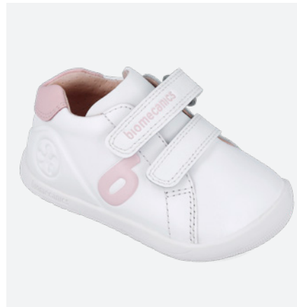
° 251010 B113