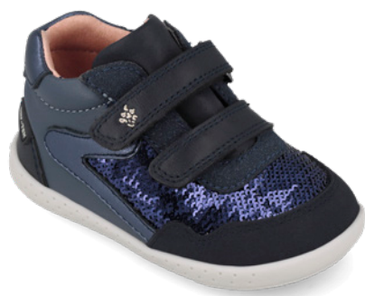
261304 A909 19/23 → 22,70 → 49,95 24/26 → 24,00 → 52,95