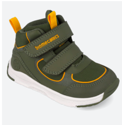
° 261177 B801 ● 261177 B801 FB