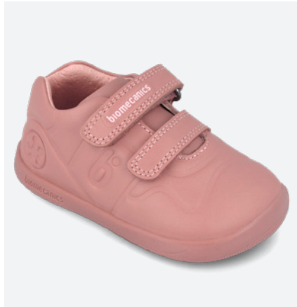
° 261015 B159