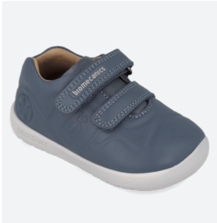
° 261015 A556 19/23→21,80→47,95 24/26→22,70→49,95