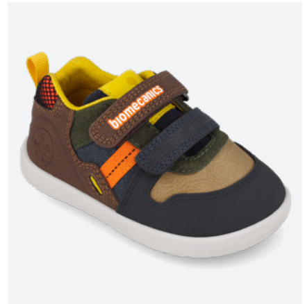
° 261156 C176