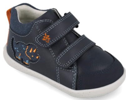
261309 A183 19/23→22,70→49,95 24/26→24,00→52,95