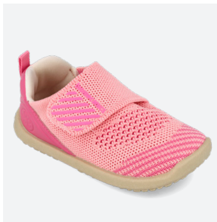
° 262188 I646

Con tejido elástico, suela deslizante y cierre regulable para un mayor confort, libertad y autonomía.