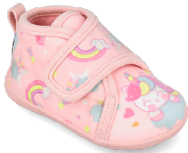
261336 A032 19/26 → 11,80 → 25,95