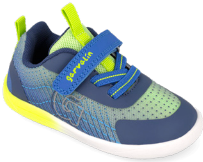
261325 A008 22/30→20,50→44,95