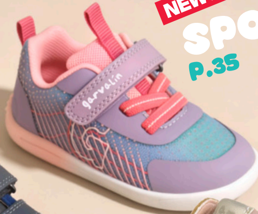
NEW IN! SPORT P.35