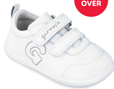
242324 A050 19/23 → 20,90 → 45,95 24/26 → 21,80 → 47,95