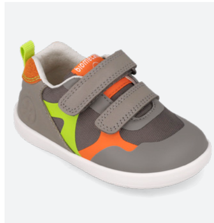
° 261168 B154