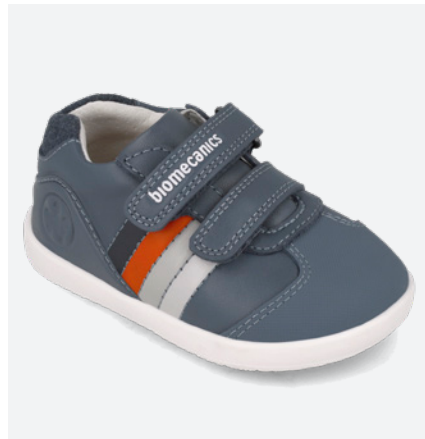
° 261155 B556