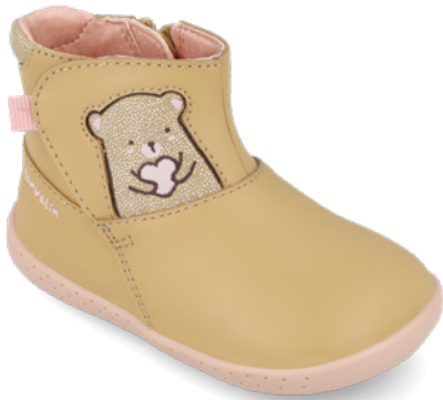
261301 A547 19/23 → 24,50 → 53,95 24/26 → 25,50 → 55,95