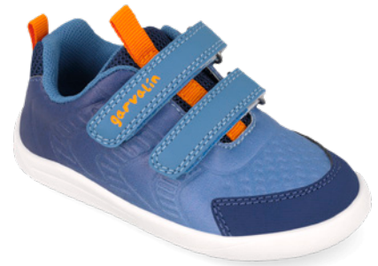
261326 A008 22/30→20,50→44,95