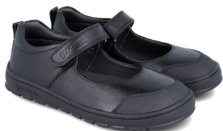
251506 A054 25/27 → 20,20 → 45,95 28/34 → 21,80 → 47,95