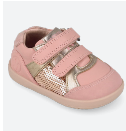
° 261166 B193