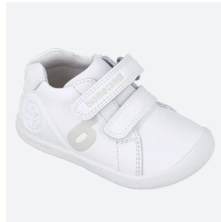
° 251010 C050