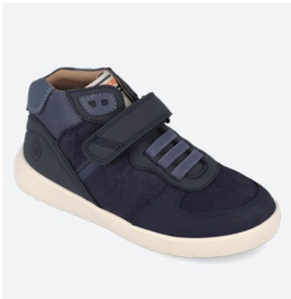
261241 A089 25/27 → 25,20 → 54,95 28/34 → 27,20 → 59,95