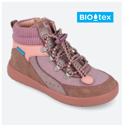
261246 A907 25/27 → 27,70 → 60,95 28/34 → 30,00 → 65,95