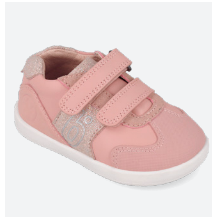
○ 261165 D193