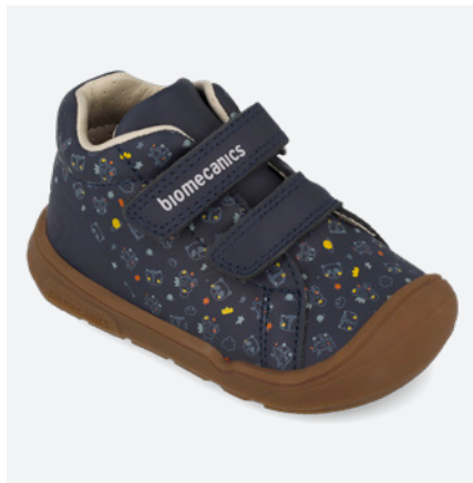
○ 261143 A089 19/23 → 24,50 → 53,95 24/26 → 25,50 → 55,95

Diseñada para resistir el ritmo diario de los niños. Un refuerzo que aporta protección adicional en la parte frontal del zapato, manteniendo la flexibilidad, ligereza y libertad de movimiento sin limitar la libertad de movimiento.