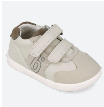
° 261165 B695

BIO o tex Resistente al agua Water resistant