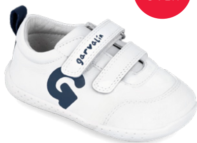
242320 A057 19/23 → 20,90 → 45,95 24/26 → 21,80 → 47,95