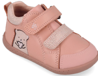
261300 B193 ● 261300 B193 - FB (Forro borreguillo) 19/23 → 23,20 → 50,95 24/26 → 24,50 → 53,95