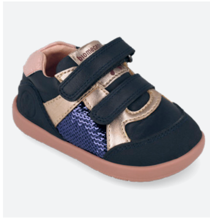
° 261166 A183 19/23→23,20→50,95 24/26→24,50→53,95