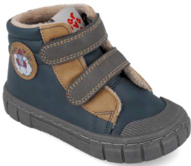
261330 A089 22/30 → 15,00 → 32,95

The comfy barefoot bootie that goes with everything... super flexible and soft!