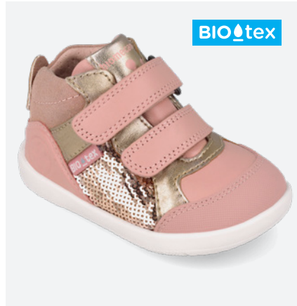
° 261167 B193

● 261167 B193 FB (Forro Borreguillo) 19/23→24,10→52,95 24/26→25,50→55,95