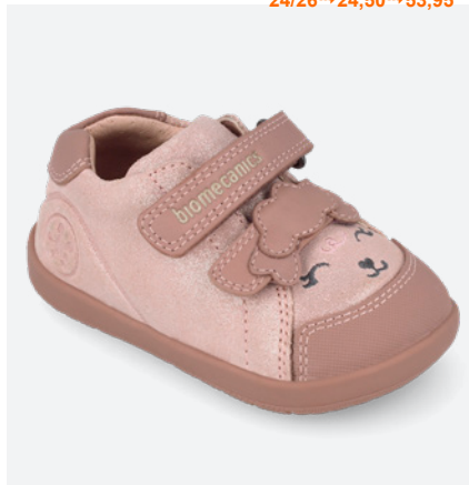
° 261160 B159