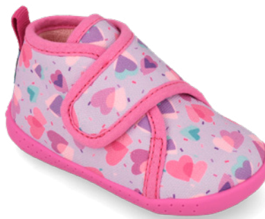
261337 A164 19/26 → 11,80 → 25,95