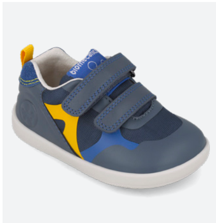
° 261168 A556 19/23→22,70→49,95 24/26→24,00→52,95