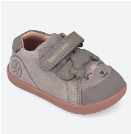
° 261160 A154 19/23→22,70→49,95 24/26→24,00→52,95