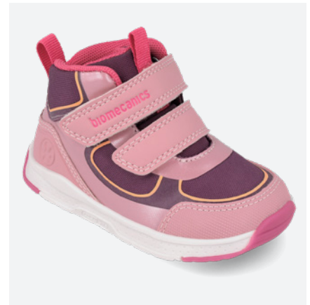
° 261177 C164 ● 261177 C164 FB