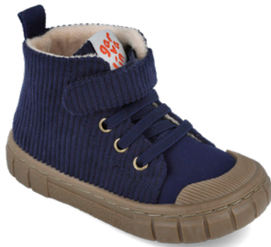
251330 A008 22/30 → 13,60 → 29,95