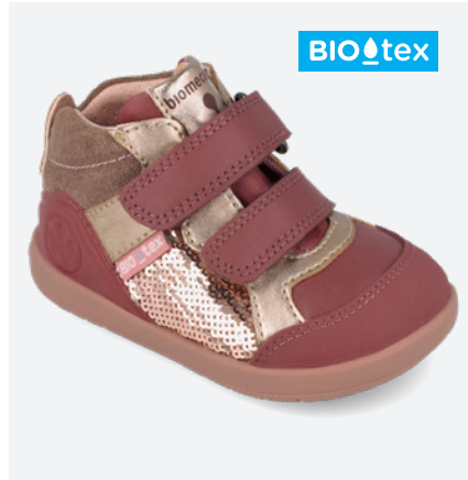
° 261167 A859 19/23→23,60→51,95 24/26→25,00→54,95