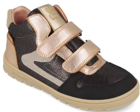
261501 A054 25/27 → 26,30 → 57,95 28/34 → 27,20 → 59,95