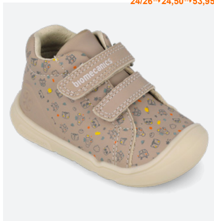
○ 261143 B208