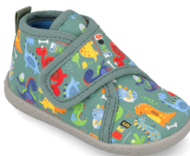
261339 A442 19/26 → 11,80 → 25,95