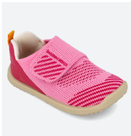
° 262188 J374

Biohome Wider combines the extra room of Wider with the comfort of Biohome. It offers warmth, comfort, and safety to enjoy every moment at home and in preschool.