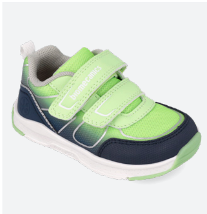
° 261176 A831 22/30 → 22,70 → 49,95