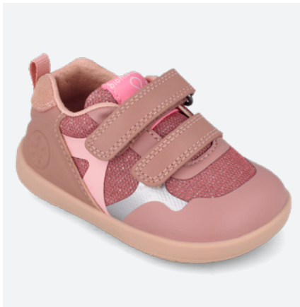
° 261168 C159 19/23→22,70→49,95 24/26→24,00→52,95

● 261167 B193 FB (Forro Borreguillo) 19/23→24,10→52,95 24/26→25,50→55,95