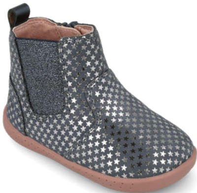
261302 A008 19/23 → 24,50 → 53,95 24/26 → 25,50 → 55,95