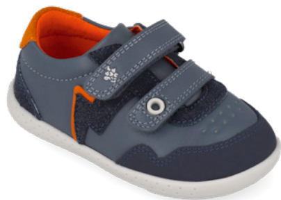
261307 A556 19/23→22,70→49,95 24/26→24,00→52,95