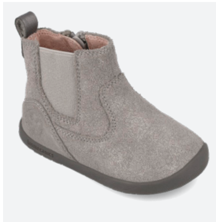
° 251155 A154 19/23 → 25,00 → 54,95 24/26 → 26,30 → 57,95