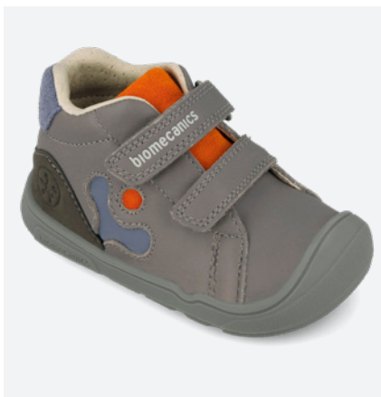
○ 261144 B156 19/23 → 22,70 → 49,95 24/26 → 24,00 → 52,95