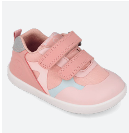
° 261168 D193