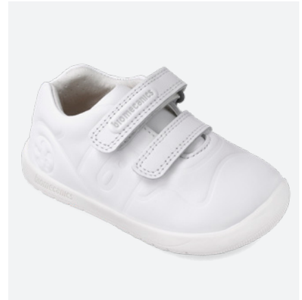
° 261015 C050