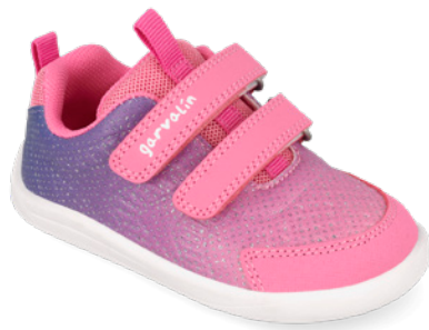
261326 C146 22/30 → 20,50 → 44,95