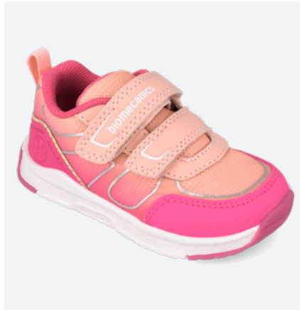
° 261176 D032