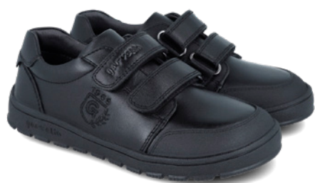
251505 A054 25/27 → 22,20 → 48,95 28/34 → 23,20 → 50,95