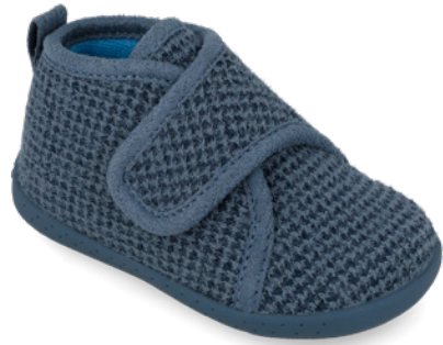
261335 A089 19/26 → 11,80 → 25,95