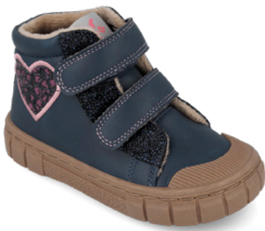
261331 A183 22/30 → 15,00 → 32,95