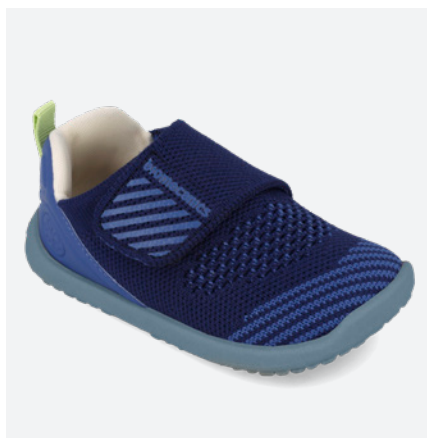
° 262188 G818 19/26-->11,80-->25,95