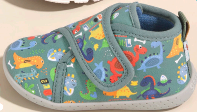
NEW IN! HOME P.38