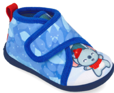
261338 A008 19/26 → 11,80 → 25,95