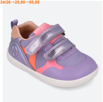
° 261168 E918

BIOtex Resistente al agua Water resistant