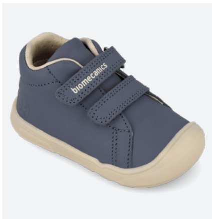
261140 D556 ● 261140 D556 FB