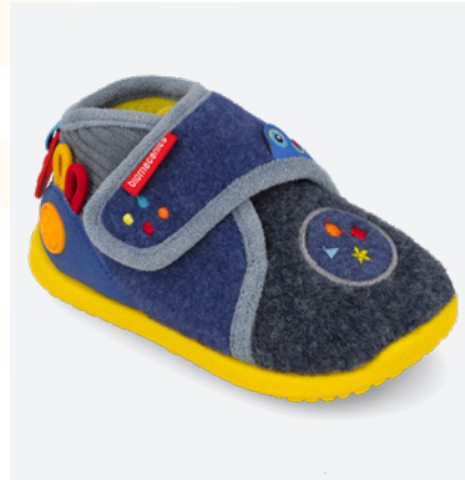
261185 A008 19/26 → 15,90 → 34,95