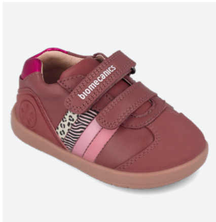
° 261155 C859 19/23→22,70→49,95 24/26→24,00→52,95