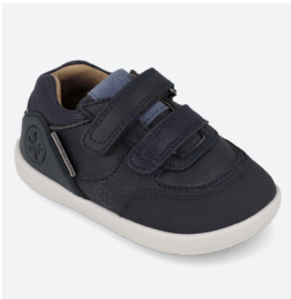
° 261151 A183 19/23→23,20→50,90 24/26→24,50→53,95