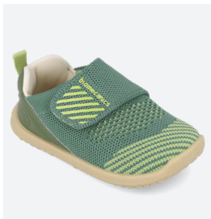
° 262188 H801

Biohome Wider combina el espacio extra de Wider con la comodidad de Biohome. Ofrece la calidez, comodidad y seguridad para disfrutar en cada momento en casa y en la escuela infantil.