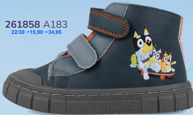
261858 A183 22/30 → 15,90 → 34,95

Designed to offer freedom and comfort in every step, they allow the foot to move naturally and support healthy development from the very first steps. Each adventure becomes a comfortable and safe experience.