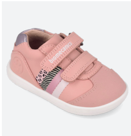
° 261155 D193 ● 261155 D193 FB (Forro Borreguillo) 19/23→23,20→50,95 24/26→24,50→53,95