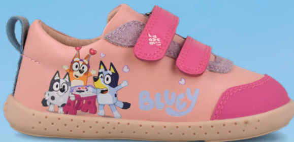
261850 A193 19/23 → 22,70 → 49,95 24/26 → 22,70 → 52,95