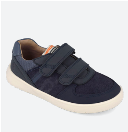
261240 A089 25/27 → 24,50 → 53,95 28/34 → 25,90 → 56,95