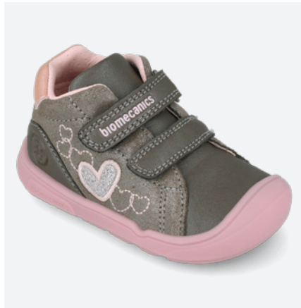
○ 261142 A168 19/23 → 22,70 → 49,95 24/26 → 24,00 → 52,95