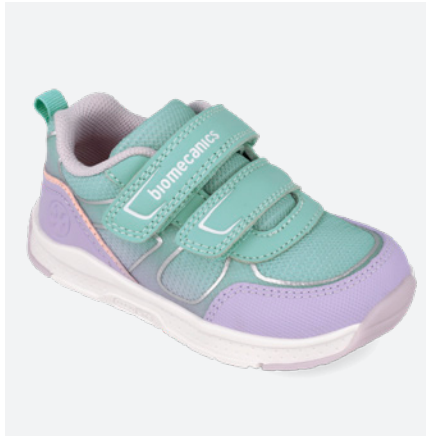
° 261176 C269