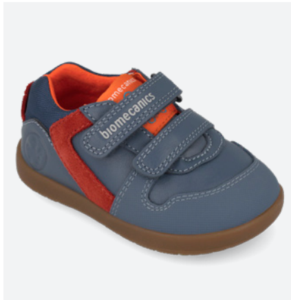
° 261150 A556 19/23→23,20→50,90 24/26→24,50→53,95