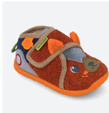
261186 A007 19/26 → 15,90 → 34,95