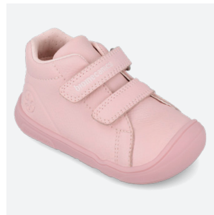
261140 C032 ● 261140 C032 FB (Forro Borreguillo) 19/23→24,00→52,95 24/26→25,50→55,95