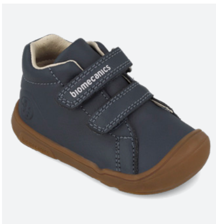
261140 A089 19/23→22,70→49,95 24/26→24,00→52,95