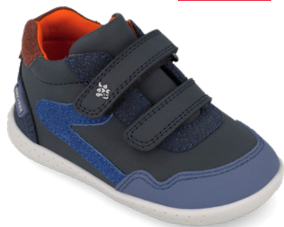
261304 D183 ● 261304 D183 - FB (Forro borreguillo) 19/23 → 23,20 → 50,95 24/26 → 24,50 → 53,95