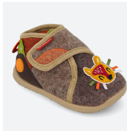
261187 A172 19/26 → 15,90 → 34,95