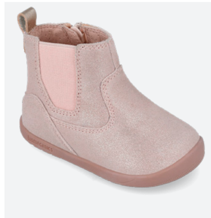
° 251155 B193