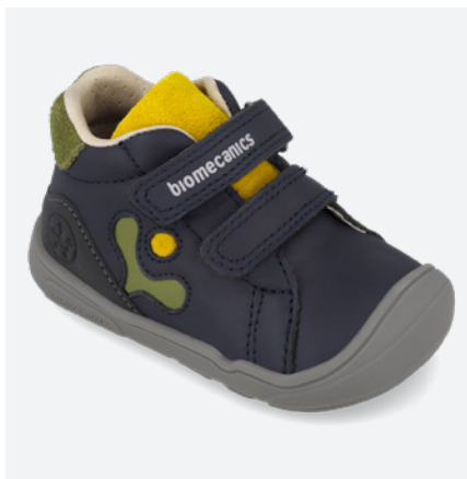
○ 261144 A089 ● 261144 A089 FB (Forro Borreguillo) 19/23 → 23,60 → 51,95 24/26 → 24,50 → 53,95

Designed to withstand the daily pace of children. A reinforcement that provides additional protection at the front of the shoe, maintaining flexibility, lightness, and freedom of movement without compromising freedom of movement.