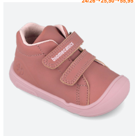
261140 G847 ● 261140 G847 FB