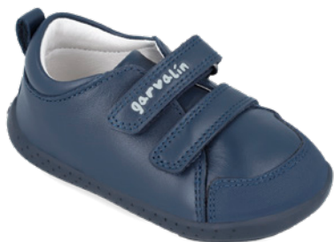
241300 A183 19/23 → 20,90 → 45,95 24/26 → 21,80 → 47,95