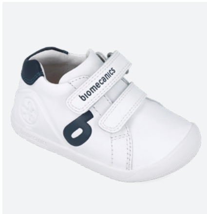
° 251010 A578 19/23 → 22,70 → 49,95 24/26 → 24,00 → 52,95