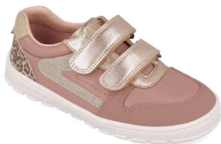
261502 A159 25/27 → 24,50 → 53,95 28/34 → 25,50 → 55,95