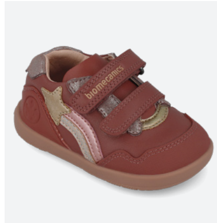
○ 261164 B859