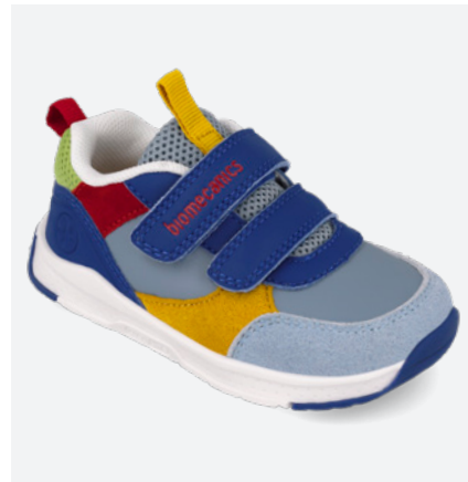
261175 A008 22/30-->22,70-->49,95

Comfort, flexibility, and lightness come together in a line with a trendy look. A modern, urban design created to accompany children in their daily routine.