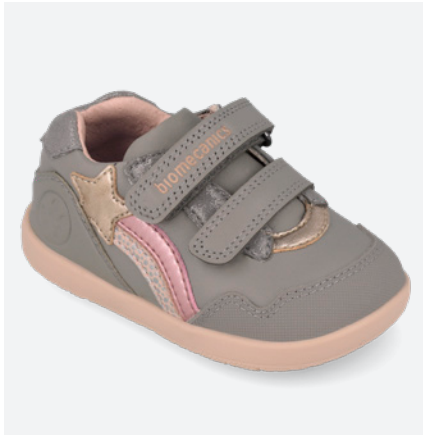
○ 261164 A154 19/23→23,60→51,95 24/26→25,00→54,95