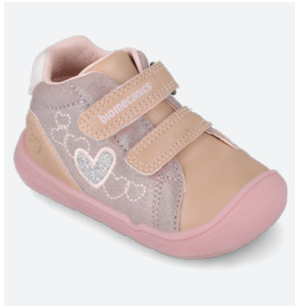
○ 261142 B892 ● 261142 B892 FB (Forro Borreguillo) 19/23 → 23,60 → 51,95 24/26 → 24,50 → 53,95