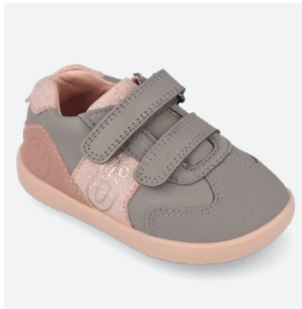
○ 261165 C154 19/23→23,60→51,95 24/26→25,00→54,95

● 261164 C193 FB (Forro Borreguillo) 19/23→24,10→52,95 24/26→25,50→55,95