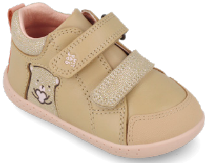
261300 A547 19/23 → 22,70 → 49,95 24/26 → 24,00 → 52,95