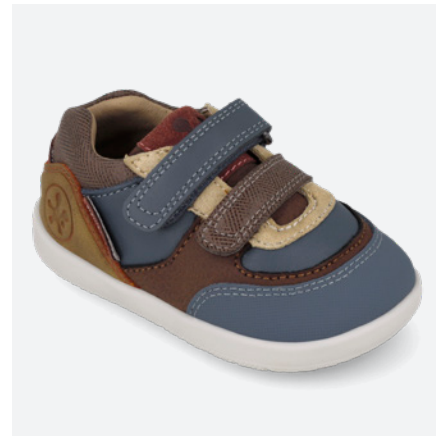
° 261151 C556

° Con estabilizador FOAMtech With FOAMtech stabilizer