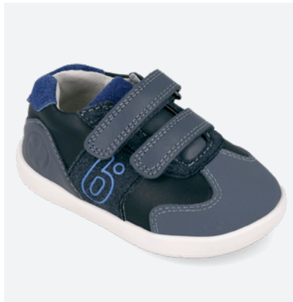
° 261165 A556 19/23 → 23,60 → 51,95 24/26 → 25,00 → 54,95