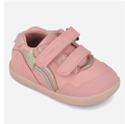
○ 261164 C193

● 261164 C193 FB (Forro Borreguillo) 19/23→24,10→52,95 24/26→25,50→55,95