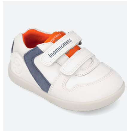
° 261150 B050