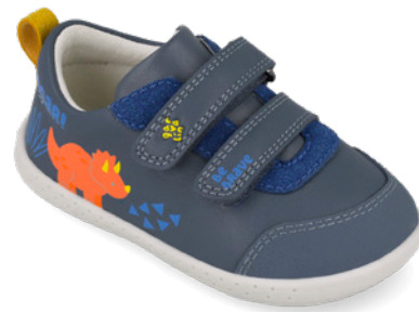
261308 A556 19/23→22,70→49,95 24/26→24,00→52,95