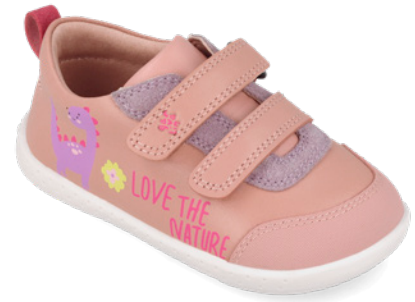
261303 A193 19/23 → 22,70 → 49,95 24/26 → 24,00 → 52,95