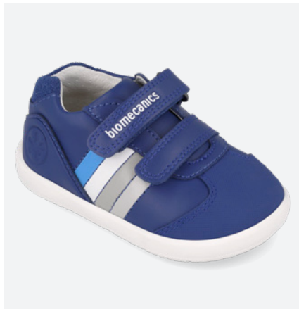
° 261155 A858 19/23 → 22,70 → 49,95 24/26 → 24,00 → 52,95