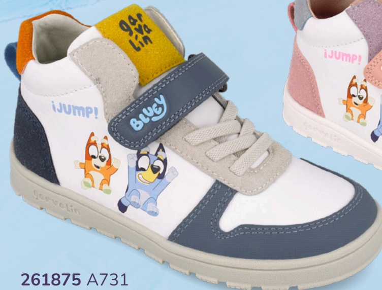
261875 A731 25/27 → 22,70 → 62,95 28/34 → 22,70 → 64,95