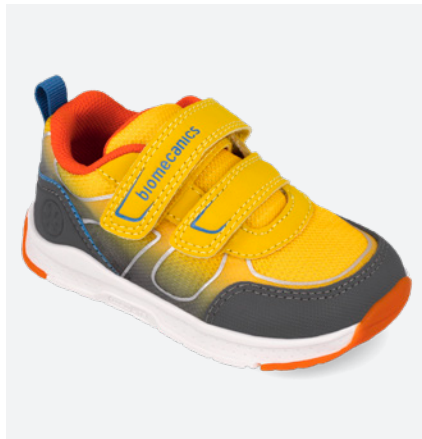
° 261176 B007