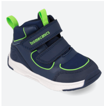
° 261177 A089 22/30 → 24,00 → 52,95 ● 261177 A089 FB (Forro Borreguillo) 22/30 → 24,50 → 53,95