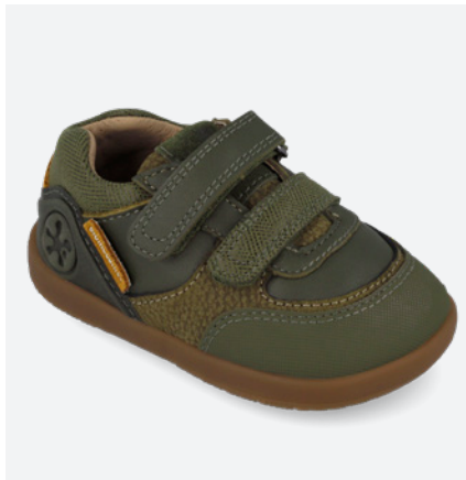
° 261151 B788 ● 261151 B788 FB (Forro Borreguillo) 19/23→23,70→51,95 24/26→24,90→54,95