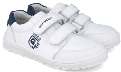
252510 A578 25/27 → 22,70 → 49,95 28/34 → 24,00 → 52,95