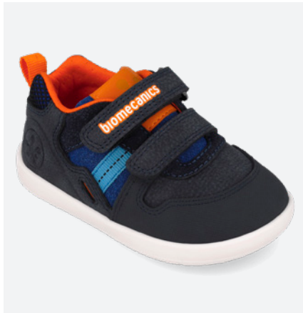
° 261156 A089 19/23 → 23,20 → 50,95 24/26 → 24,50 → 53,95